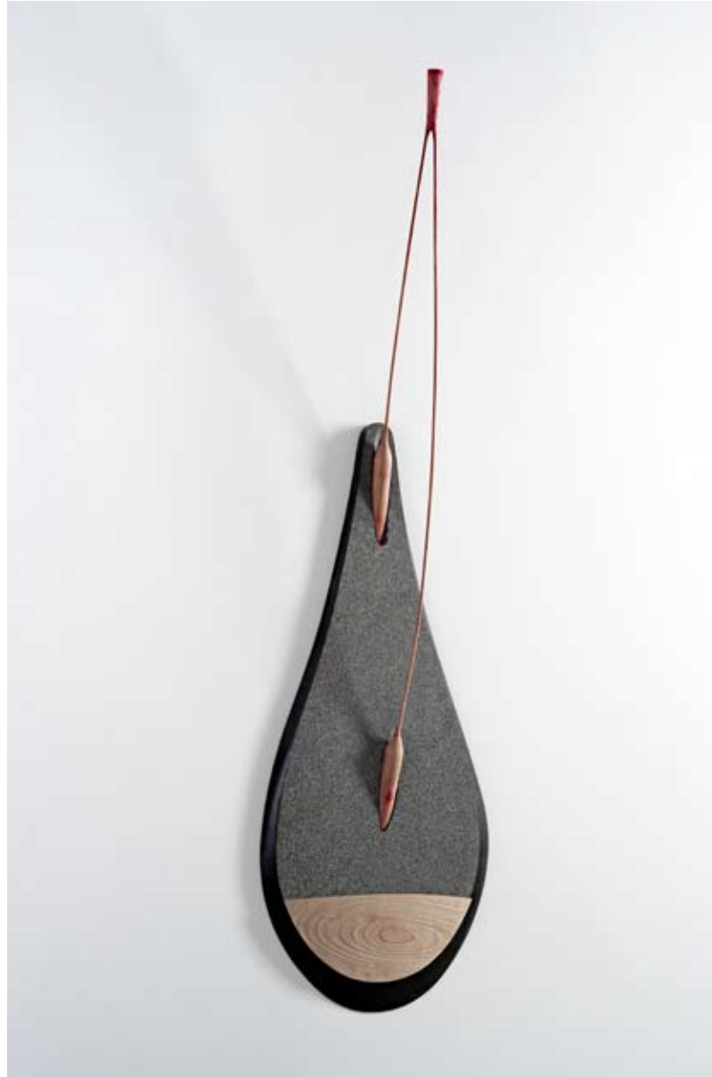
NEŠTO NEDOVRŠENO | kamen, drvo 2010 SOMETHING ANFINISHED | stone, wood