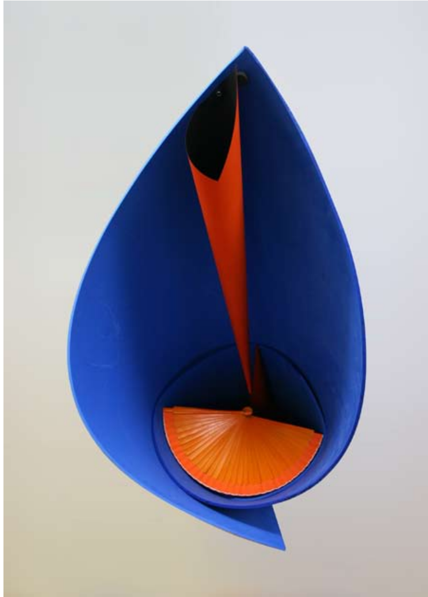
JEDAN, DVA, TRI | guma, lepeza, sundjer, papir 2011 ONE, TWO, THREE | rubber, fan brush, sponge, paper