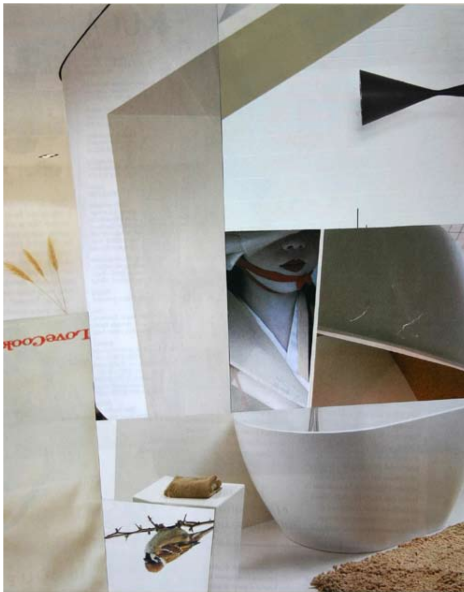
KIMONO | kolaž 2010 KIMONO | collage