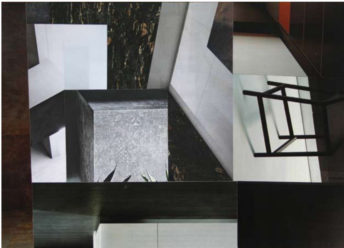
GDE VI RADITE? | kolaž 2010 WHERE YOU WORK? | collage