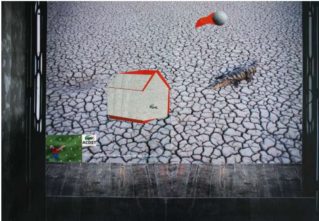
TRI KROKODILA | kolaž 2010 THREE CROCODILES | collage