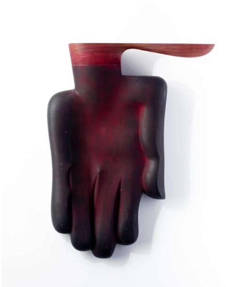
RUKAVICA | porcelan 2011 GLOVE | porceline