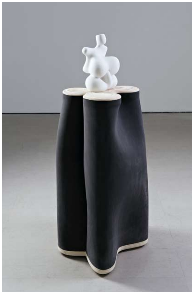
ARP POSLE PEDESETE | guma, drvo, gips 2011 ARP AFTER FIFTIES | tire, wood, glet