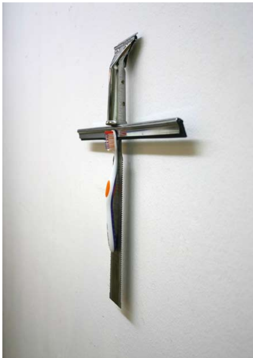
LIČNE STVARI | brisač, testera, četkica za zube | 2011 PRIVATE THINGS | wiper, saw, toothbrush